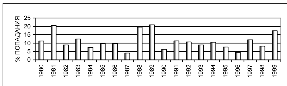
Рис.2. Динамика численности мелких млекопитающих в Николаевской области (по данным числа попадания в ловушки, в %%)

По архивным данным Украинского научно-исследовательского противочумного института в целом по Николаевской области за 20 лет (с 1980 по 2000 год) этот показатель составил 11.45 \pm 0.1\% , т.е. можно считать, что численность мелких млекопитающих на обследованной территории статистически достоверно на 3% выше многолетнего показателя в целом по области. Учитывая наши данные по динамике численности мелких млекопитающих в Николаевской области за указанный период (рис.2), можно отметить, что в области было 3 пика численности: в 1980-81гг., 1988-1989гг. и в 1999г. т.е. с периодом 8-9 лет, процент попадания возрастал до 17-22%. Таким образом, если выявленная тенденция справедлива, то в период обследования мы наблюдали именно очередной подъем численности по Николаевской области.