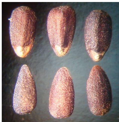
Рис. 1. Внешний вид семян H. officinalis (увеличено в 170 раз).

Детальный анализ семян различных по окраске цветка морфологических форм не выявил каких-либо существенных различий во внешнем строении. Поэтому мы можем утверждать, что семена H. officinalis имеют следующие метрические параметры: длина – 2,64 \pm 0,125 мм, ширина – 1,14 \pm 0,112 мм, средняя масса 1000 семян составляет 1,161 \pm 0,2412 г (min – 0,930 г, max – 1,445 г).